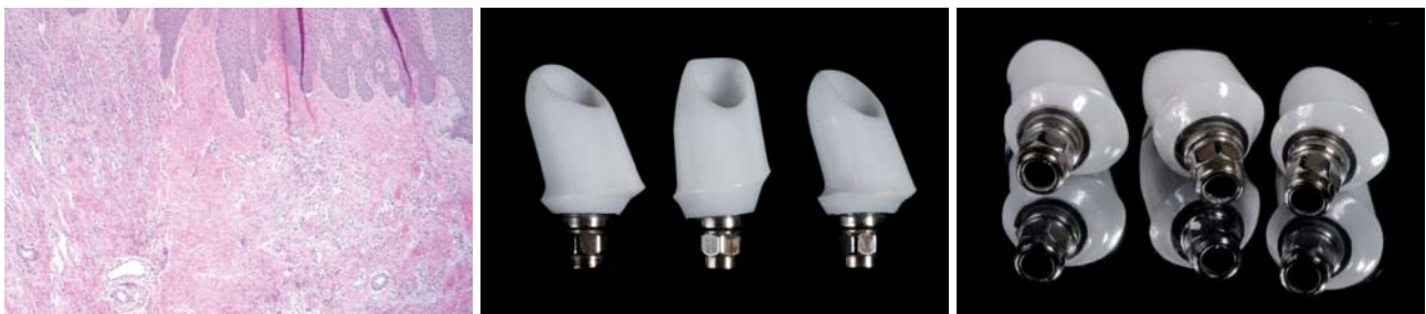
Abb. 1: Pseudo-hemi-desmosomale Weichgewebsstruktur an einem Zirkonabutment (Cercon/XiVE, Fa. DENTSPLY Friadent). – Abb. 2a und b: Individuelle Abutments, Titan-Zirkon gelötet (hotbond Fa. DCM, Aesthetic Base/XiVE, Fa. DENTSPLY Friadent).

Herstellung jeder Implantatprothetik spielt. Durch moderne CAD/CAM-Techniken ist heutzutage bei der Abutmentindividualisierung eine dreidimensionale Ausdehnung von Implantatabutments kein Problem mehr. Aus biologischen Gründen ist weiterhin die Verwendung von Zirkon in dem sogenannten Durchtrittsbereich unumgänglich. Durch die Weichgewebsanlagerung an das Zirkon können „Pseudo-hemi-desmosomale“ Attachments (siehe Abb. 1) entstehen. Das zirkuläre Weichgewebe am Implantatpfosten lagert sich also ähnlich wie an echten Zähnen bindegewebig an. Diese Form des Attachments bildet die natürlichste und belastbarste Form der Weichgewebsanlagerung. Es bilden sich kleine Bindegewebsbrücken, die fest an der Zirkonstrukturanhaften. Warum also nicht? Da die Verwendung von reinen Cerconabutments strikt auf den Frontzahnbereich limitiert ist, konnten bisher also im Seitenzahnbereich lediglich reine Titanpfosten Verwendung finden. Die Stabilität und die Friktion von Titanabutments im Bereich der Implantatverankerung weist allerdings die höchste Verlässlichkeit auf. Hiermit ist ein Titan-keramischer Pfosten die sinnvollste Entwicklung. Um eine dreidimensionale Durch-