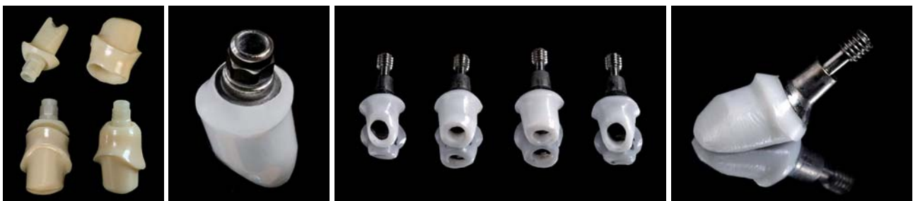
Abb. 3: Cercon Abutment (XiVE, Fa. DENTSPLY Friadent) Keramik mit gelötetem Durchtrittsprofil aus Zirkon (Fa. DCM, Rostock). – Abb. 4: Titankeramisches Abutment (Fa. DENTSPLY Friadent) mit aufgelöteter Sekundärstruktur, emergenzprofiliert. Jedes Einzelne ist ein Unikat. – Abb. 5a und b: Titan-keramische Abutments mit Ankylospfosten, jeder ist ein „Einzelstück“ (Fa. DENTSPLY Friadent, Fa. DCM Rostock).